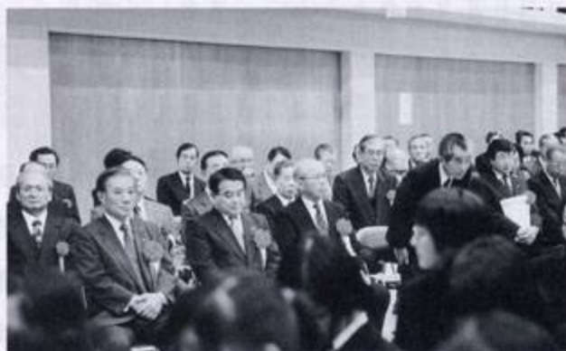
お客様方を迎えて