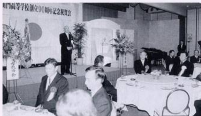
●柳川御花での祝賀会