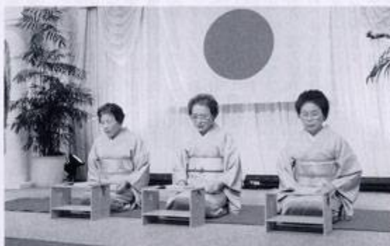
卒業生による祝詞