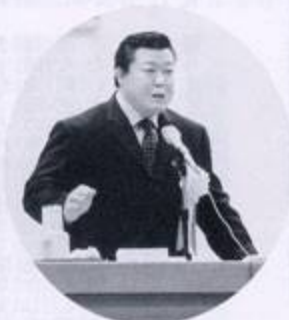
智乃花岡の記念講演