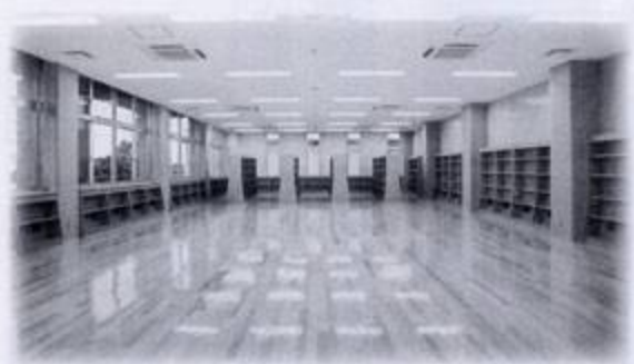
▲図書館約24,000冊の蔵書

本校創立九十周年記念事業につきましまして、昨年九月に新図書館と併せて同窓会館が開館となり、同窓会のご好意により各種会合等に活用させて頂いておられます。校門横の記念庭園につきましても、本校の発展をイメージした設計がなされ、本年度末に完成の運びとなりました。また、父母